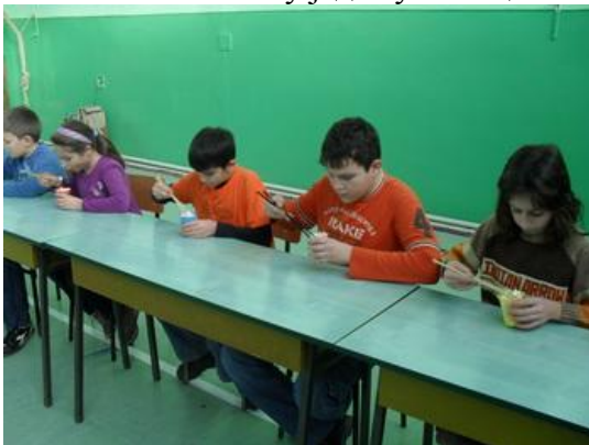
Такмичење у једењу кокица