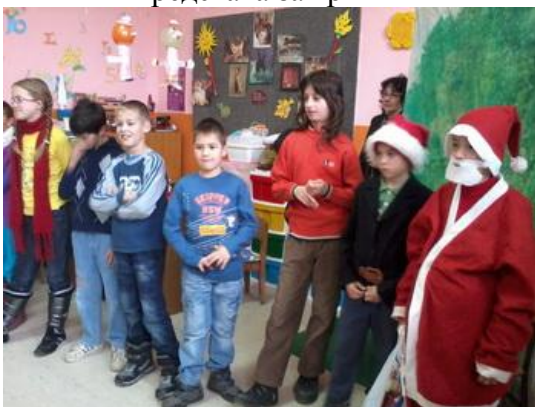
Представа за вртић