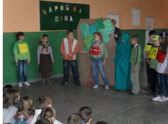
„Чаробна шума“ Представа ученика 3-2