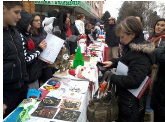
Дечији базар - Темерин